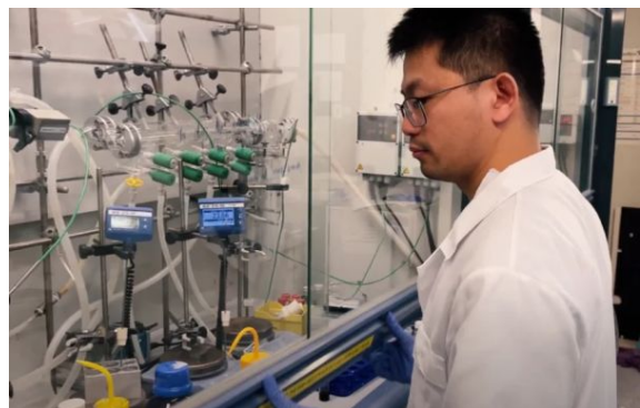
Enllac a l'article