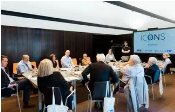
Presentació de l'organització d'estudiants ICONS