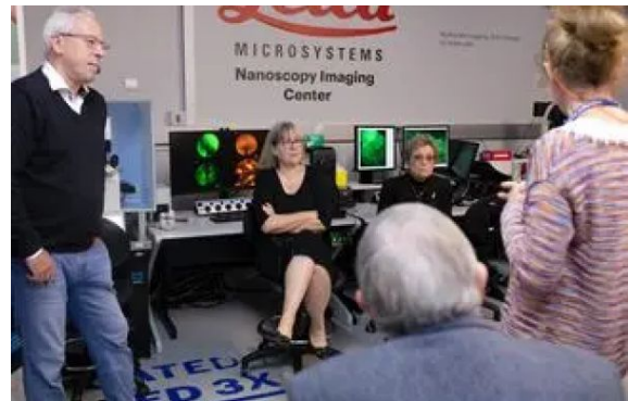
Visita a les instal·lacions del SLN