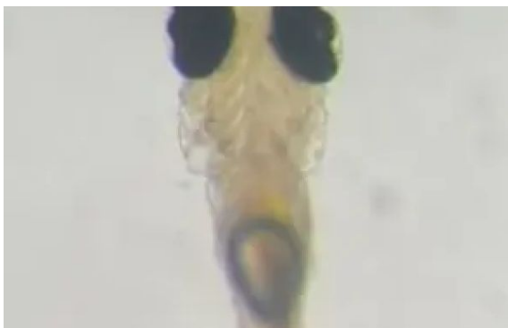
Larva de pez cebra

Para su trabajo futuro, los investigadores planean aplicar estimulaciones aún más cortas y focalizadas para estudiar estas respuestas endógenas en detalle.