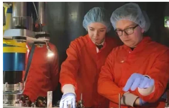
Infografía de la polarizacion de los Valles