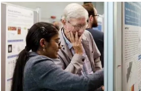
Sesion de posters con todos los grupos de investigacion